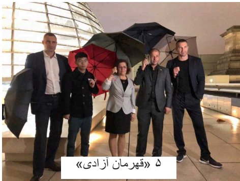
۵ «قهرمان آزادی»

در سپتامبر ۲۰۱۹ در یک مهمانی به دعوت روزنامه آلمانی «بیلد» از ۵ شخصیت تحت نام «۵ قهرمان آزادی» در پارلمان آلمان پذیرایی شد. این شخصیتها چه کسانی بودند؟