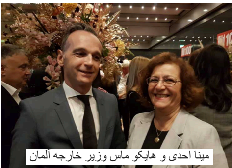
مینا احدی و هایکو ماس وزیر خارجه آلمان

• رائد الصالح عضو سازمان «نجات شهروندان» سوریه معروف به «کلاه سفیدها» (White Helmet) که در سال ۲۰۰۳ تشکیل شد. این سازمان توسط جیمز لو مسوری (James Gustaf Edward Le Mesurier) در ترکیه تعلیم داده شد. لو مسوری، ارتشی دولت بریتانیا، که شغلش تعلیم نظامی بود برای بخش سازمان ملل در کوسوو کار میکرد و مشاور در سفارت آمریکا در بغداد بود. وی همچنین مسیول تعلیم سازمان «کلاه سفیدها» در ترکیه بود که توسط دولت های آمریکا، بریتانیا و ژاپن تامین مالی میشد.