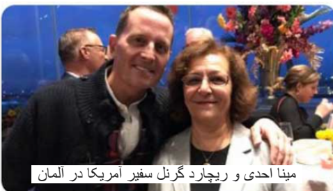
مینا احدی و ریچارد گرنتل سفیر آمریکا در آلمان

• میخائیل کدورکوفسکی سرمایه دار روسی مخالف پوتین.