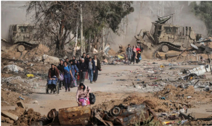
زنان در فرار به ناکجا آباد زیر بمب های اسرائیل - آمریکا

بزرگترین خشونت تاریخی نسبت به زنان در همین لحظه، در مقابل چشمان بشریت، زیر بمب ها و تانک های اسرائیلی - آمریکایی در جریان است. این جنایت و خشونت باید متوقف شود! جنبش آزادی زن باید تمام قد، استوار و متحد برای توقف این جنایت به میدان بیاید. این لکه ننگی است بر تاریخ بشریت، بر وجدان انسانی و بر کارنامه هر کسی که به هر دلیل و توجیهی چشم بر این جنایت بسته است.