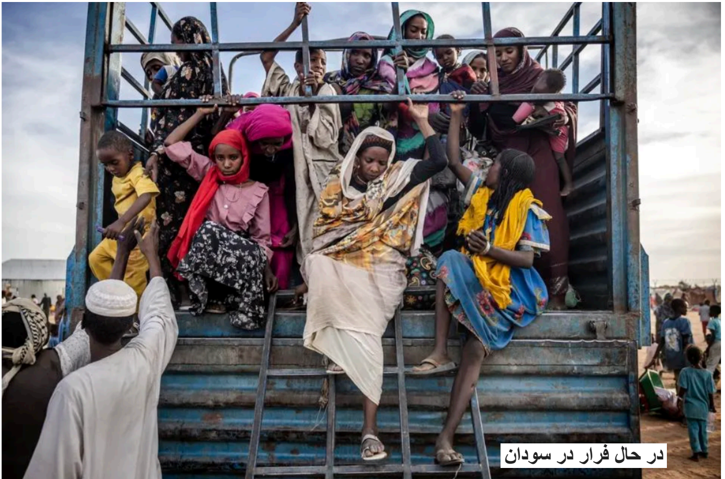
در حال فرار در سودان