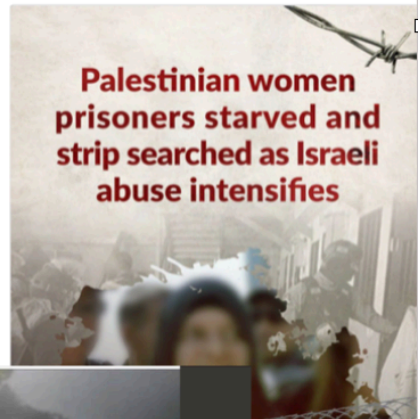
Palestinian women prisoners starved and strip searched as Israeli abuse intensifies