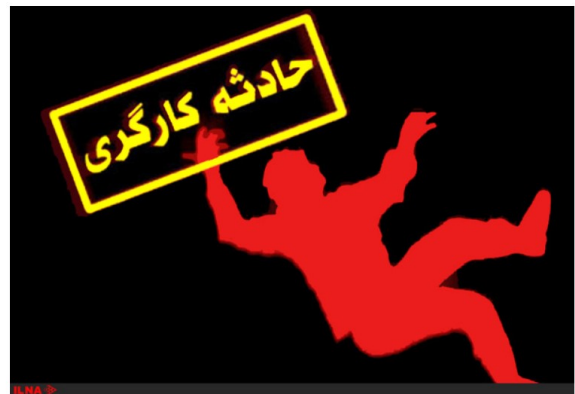
یک کارگر ساختمان به علت سقوط از بالابر جان باخت.

خبرگزاری هرانا - طی روز گذشته در سایه فقدان ایمنی محیط و شرایط کار، ۳ کارگر طی یک حادثه در شهرستان هرسین دچار حادثه شدند. در این حادثه یک کارگر جان خود را از دست داده و ۲ کارگر دیگر مصدوم شدند. ایران در زمینه رعایت مسائل ایمنی کار در میان کشورهای جهان رتبه ۱۰۲ را به خود اختصاص داده که رتبه بسیار پایینی است.