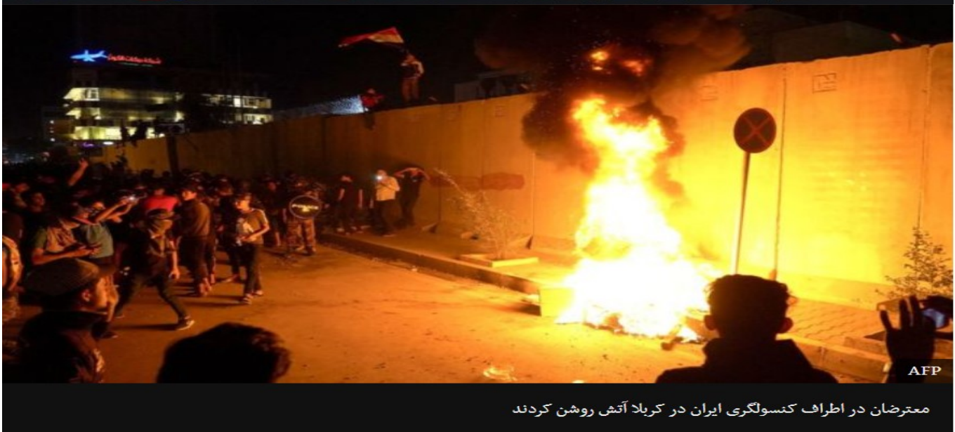
معترضان در اطراف کنسولگری ایران در کربلا آتش روشن کردند