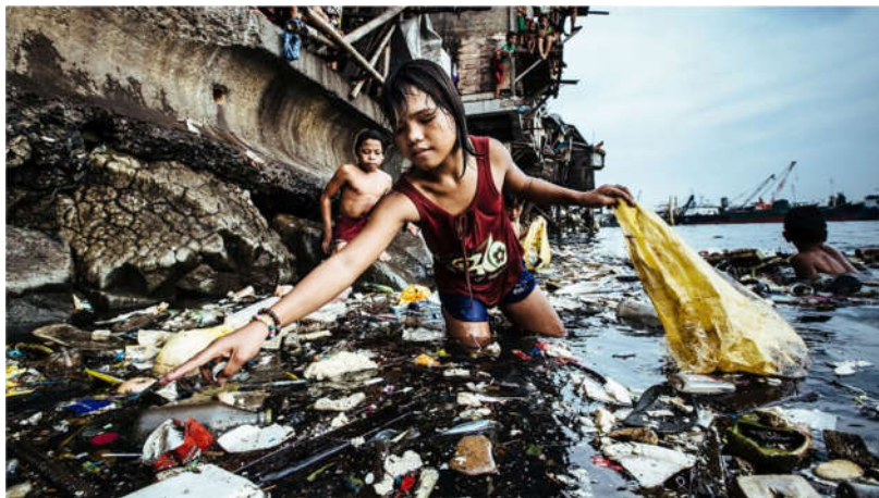
عکس سال یونیسف (صندوق کودکان سازمان ملل متحد) سه فاجعه در یک قاب: فقر، کار کودکان و آلودگی محیط زیست

بر اساس «گزارش سالیانه دبیرکل درباره کودکان و مناقشات مسلحانه در سال ۲۰۱۹» بیش از ۱۲ هزار کودک در سال گذشته میلادی در مناطق تحت مناقشه کشته شده یا به صورت دائم دچار معلولیت شده اند. این رقم بالاترین میزانی است که از زمان شروع نظارت و گزارش‌دهی سازمان ملل درباره این موضوع ثبت شده‌است. این آمار تنها نشان دهنده موارد تایید شده هستند و رقم واقعی احتمالاً بسیار بالاتر است. یونیسف تخمین می‌زند که در یک چهارم این رویدادها کودکان کشته می‌شوند. کودکان در مناقشات کنونی در افغانستان، جمهوری آفریقای مرکزی، سومالی، سودان جنوبی، سوریه، یمن و بسیاری مناطق دیگر بیش‌ترین هزینه جنگ را پرداخت می‌کنند. تداوم استفاده گسترده از تسلیحات انفجاری به مانند بمباران هوایی، مین‌های زمینی، خمپاره، مواد منفجره دست‌ساز، حملات موشکی، مهمات خوشه‌ای و گلوله باران توپخانه‌ای بیش‌ترین تلفات را به کودکان در مناطق تحت مناقشه وارد کرده‌اند. فور در ادامه سخنانش می‌گوید: «در حالی که بسیاری از کودکان در هفته جاری به مدارس بازمی‌گردند، ما افکار عمومی را متوجه هزاران کودکی می‌کنیم که در مناطق مناقشه‌کشته شده‌اند. مرگ تراژیک این کودکان در خانه‌ها، کلاس‌ها و جوامع آن‌ها در سراسر جهان احساس خواهند شد. دستاوردهای چشم‌گیری که در سی سال گذشته برای کودکان به دست آمده آشکارا نشان می‌دهند که اگر اراده سیاسی برای اولویت قائل شدن به کودکان را داشته باشیم به نتایج بسیاری دست خواهیم یافت.»