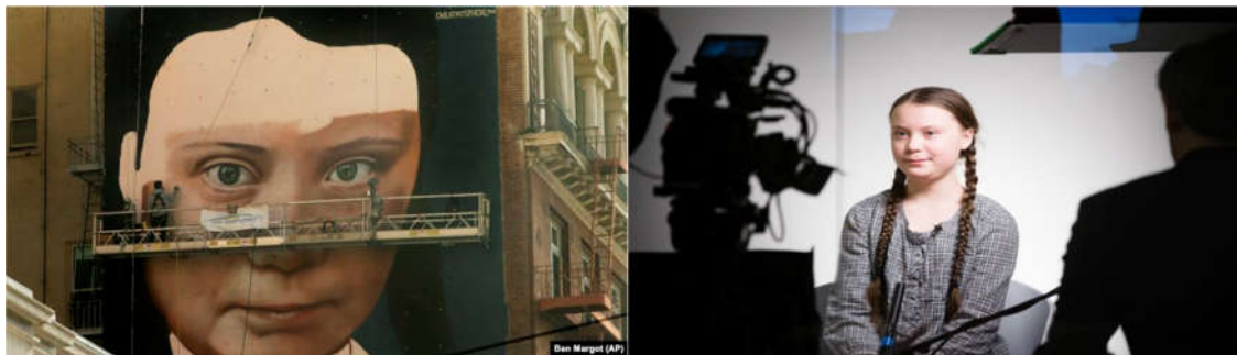
یک نقاشی دیواری از گرتا تونبرگ، فعال محیط زیست، در شهر سانفرانسیسکو آمریکا

حفاظت از محیط زیست در بسیاری از کشورها به یکی از مهم ترین مسائل بدل شده است. اما روشن است نخست هر اقدامی برای مواجهه با تغییرات اقلیمی که نیازهای اکثریت ساکنان کره زمین را لحاظ نکند به طرز فاجعه باری شکست خواهد خورد. و دوم آن که، این نیازهای اساسی شامل نه فقط غذا، مراقبت درمانی و مسکن، بلکه منزلت و اشکال گوناگون همبستگی نیز می شود.