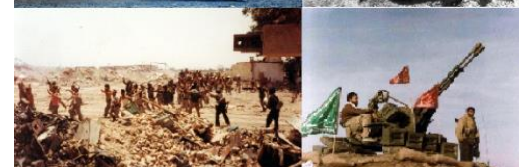
ارمغان حکومت اسلامی برای ملت ایران

تروریست های حکومتی با تجهیزات کامل جنگی مردمان بی گناه ما را در شهرهای سراسر کشور قتل عام می کنند. ده ها شهر و صدها نقطه ی ایران غرق آتش و خون شده است، آدمکشان حکومت اسلامی به زن و مرد، پیر و جوان و حتا کودک هم رحم نمی کنند. از بهمن ماه ۱۳۵۷ تا کنون حکومت اسلامی