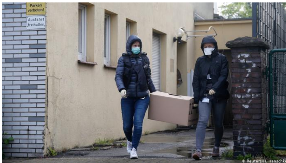
عملیات پلیس آلمان علیه حزب‌الله لبنان، دورتموند، آوریل ۲۰۲۰

به گزارش رسانه‌های آلمان در روز جمعه ۷ اوت، نهادهای امنیتی این کشور زمانی که مشغول تحقیق درباره فعالیت‌های حزب‌الله لبنان در این کشور بودند، متوجه انبار نیترات آمونیوم این گروه در ایالت بایرن می‌شوند. به‌گفته سازمان امنیت داخلی آلمان، حزب‌الله لبنان در ایالت بایرن یک انبار نیترات آمونیوم داشته که در سال ۲۰۱۶ محتویات آن از آلمان خارج شده است. فعالیت حزب‌الله از ماه آوریل در آلمان ممنوع شده است.