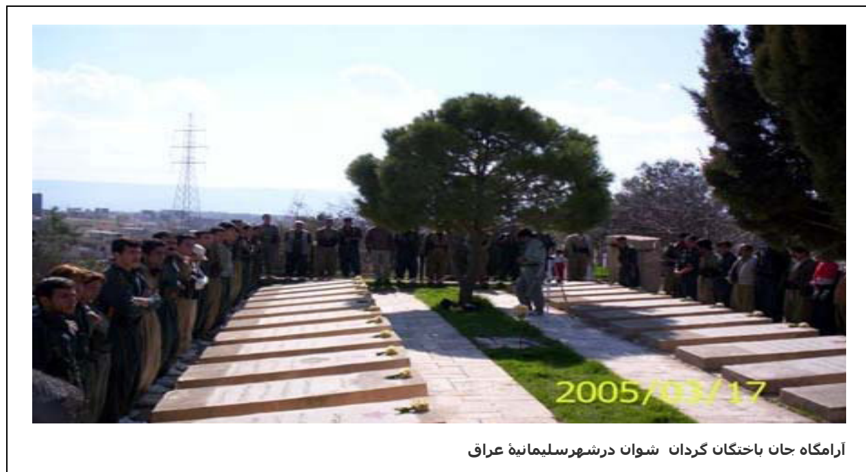
آرامگاه جان باختگان گردان شوان در شهر سلیمانیه عراق